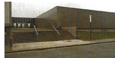
Espace sportif de l'Etoile, Alençon