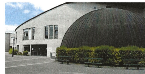
Collège Saint-Exupéry, Alençon